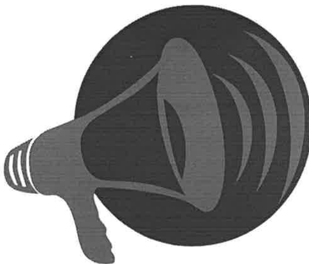
Forum National du SNJ (25 mai 2000)