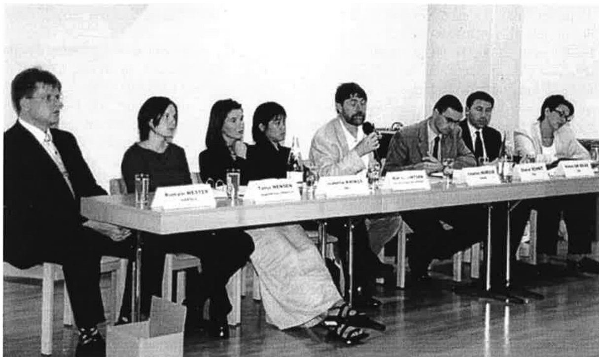
Présentation du résultat de la « Jugendemfro Norden 2000 » à Hosingen.

Dans la publication Touareg.lu qui est parue dans le cadre du projet « Caravane de l'an 2000 » se trouvaient des questionnaires à détacher à l'attention des jeunes. Des urnes pour les questionnaires remplis étaient installées dans la tente de la Caravane. Les résultats de ce projet furent assemblés par le CESIJE. Après considération, le bureau de la CGJL a décidé de ne pas